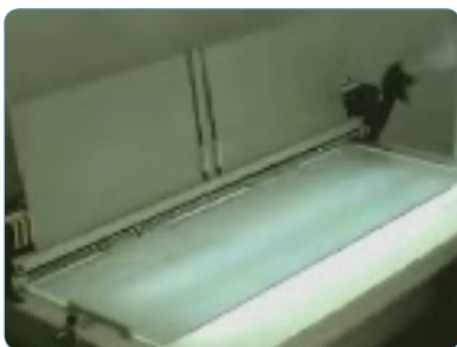
Posicionamiento central, La máquina toma el uso del principio de la reflexión y refracción de la luz para posicionar la tapa en la zona central