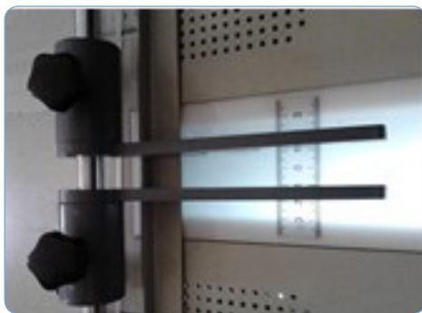
La cubierta, cartón y guía central del lomo se puede ajustar y posicionados con precisión.

Su robustez y sencillo manejo la hacen ideal para todo tipo de colocación de tapas.